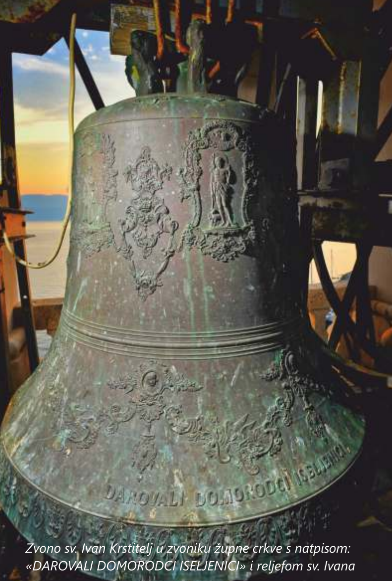
Zvono sv. Ivan Krstitelj u zvoniku župne crkve s natpisom: «DAROVALI DOMORODCI ISELJENICI» i reljefom sv. Ivana