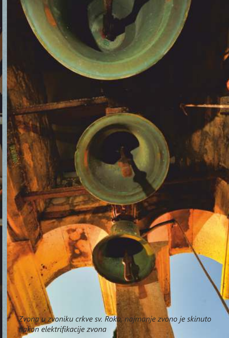
Zvona u zvoniku crkve sv. Roka, najmanje zvono je skinuto nakon elektrifikacije zvona