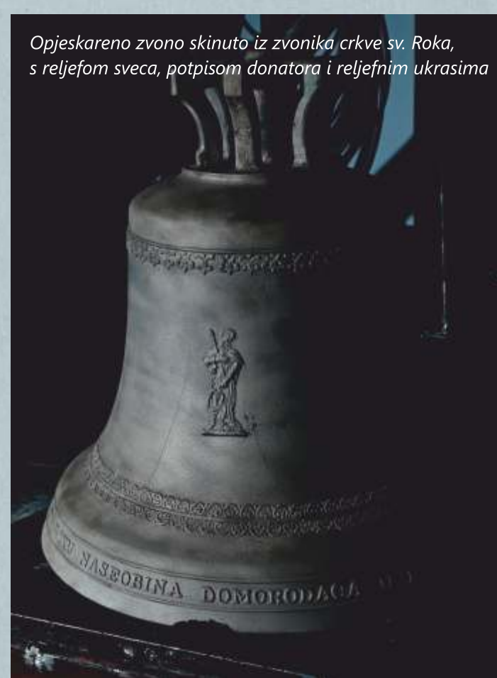
Opjeskareno zvono skinuto iz zvonika crkve sv. Roka, s reljefom sveca, potpisom donatora i reljefnim ukrasima