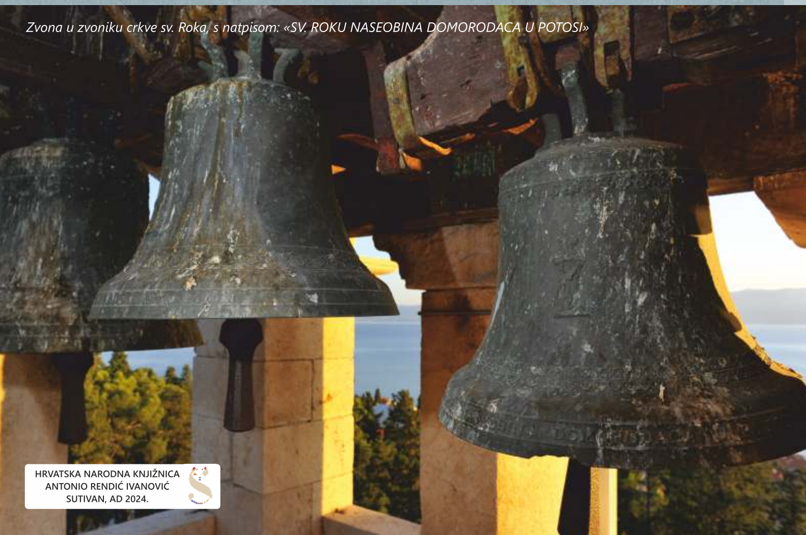
Zvona u zvoniku crkve sv. Roka, s natpisom: «SV. ROKU NASEOBINA DOMORODACA U POTOSI»

Among its many features that set it apart from other Adriatic towns and small towns, Sutivan is characterized by its unique appearance with two elegant campanels (church bell towers) that form its recognizable visual identity and are the motif of countless photographs, paintings and drawings. One was built next to the parish church of the Ascension of Virgin Mary and it is decorated with an elegant baroque dome, and the other above the town on the hill next to the church of St. Roko (Rocco), one of Sutivan's heavenly protectors.